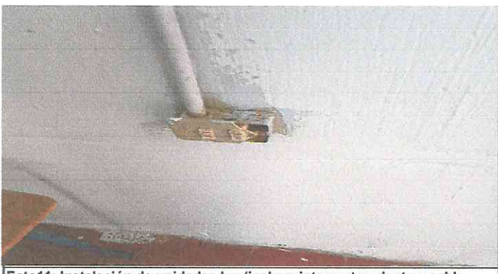
Foto11: Instalación de unidades luz (incluye interruptor, ducto y cable eléctrico)