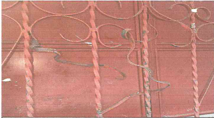
Foto7: Mantenimiento a estructura (lijado, cambio de tubo , cepillado, sujeciones, aplicación de pintura)